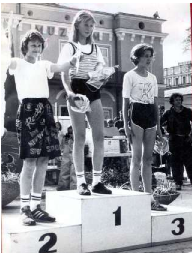
Nasi najlepsi sportowcy 1987 rok.