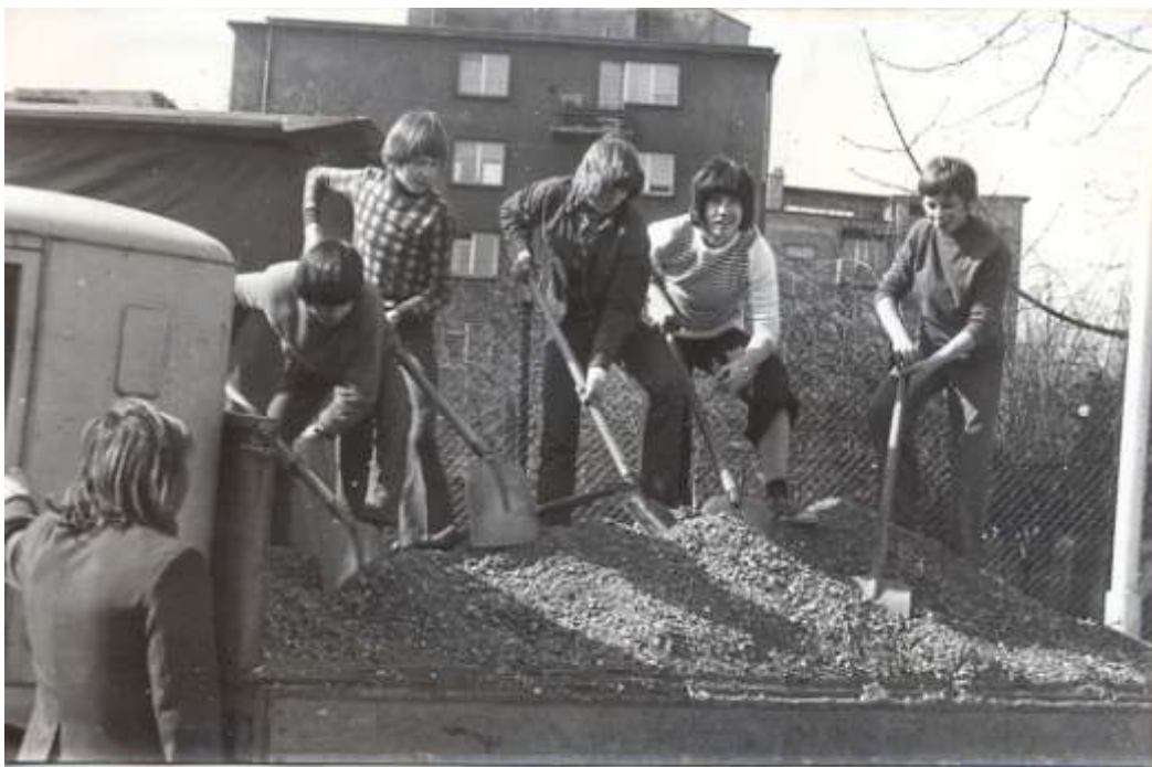
Budowa boiska szkolnego.