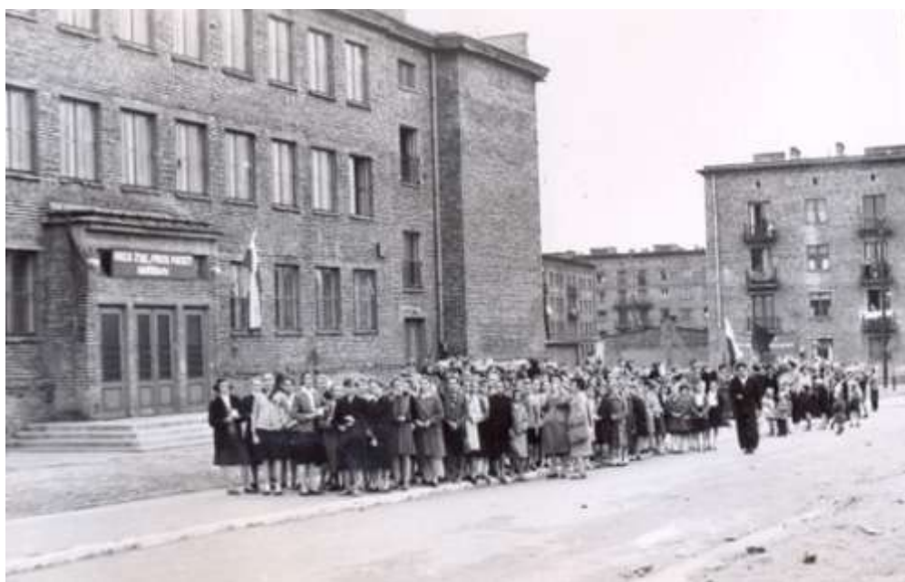
Zdjęcie budynku szkoły z lat 50-tych.

Na skutek intensywnej rozbudowy północnego Rakowa i ciągłego napływu mieszkańców nowych dzielnic, ilość istniejących już szkół nr: 20, 17, 19, 26, okazała się niewystarczająca. Z końcem 1957r. oddano do użytku Szkołę Podstawową nr 7 przy ulicy Zamenhofa.