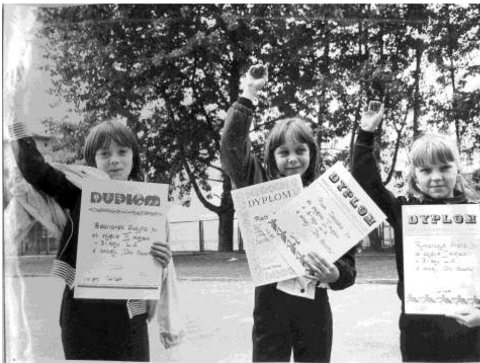
Dzień dziecka i sportu rok szkolny 1986/87.