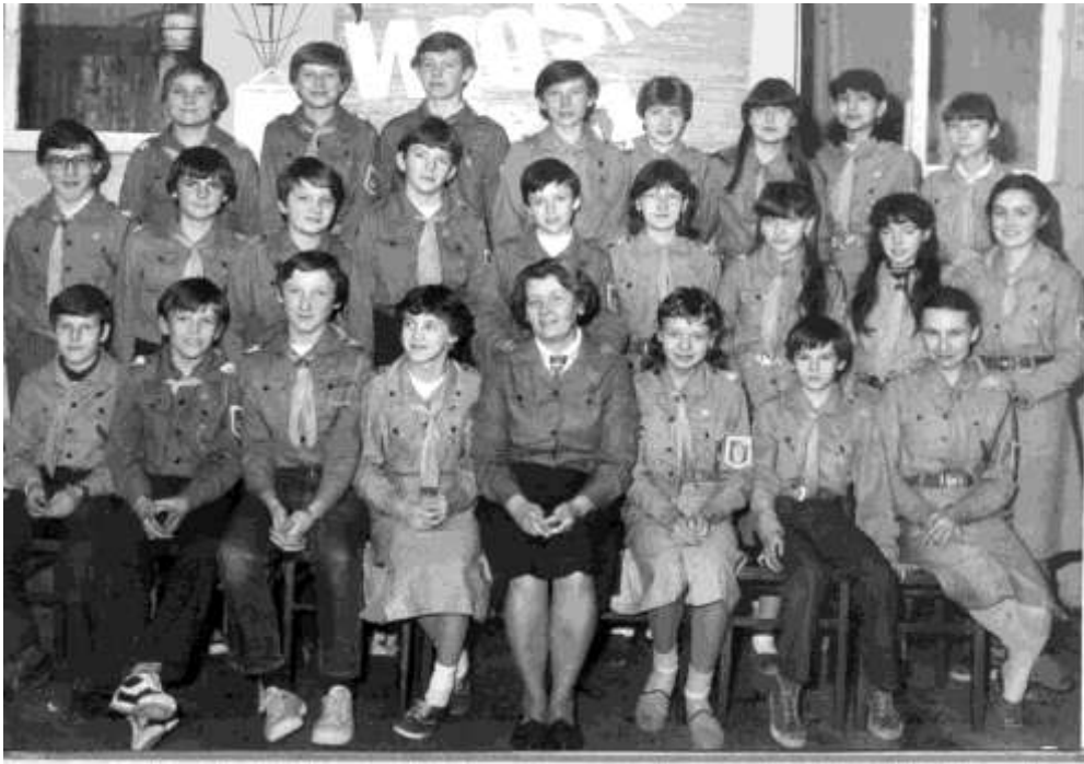
Drużyna harcerska 1984.