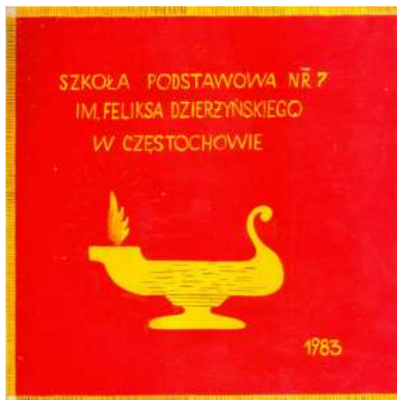
Sztandar Szkoły Podstawowej nr 7 w Częstochowie

Na początku lat 70-tych podjęto współpracę z Hutą im. B. Bieruta – Wydział Stalownia. Dyrekcja przedsiębiorstwa zawarła ze szkołą umowę. Uczniowie raz w tygodniu przez 6 godzin uczą się zawodu w warsztatach szkolnych kombinatu metalurgicznego. Oczywiście, wszystko to dzieje się za zgodą rodziców. Młodzież została przeszkolona w zakresie bezpieczeństwa i higieny pracy. Zajęcia praktycznej nauki zawodu odbywają się pod opieką nauczycieli. Zawarta z Hutą im. B. Bieruta umowa przewiduje, że wszyscy absolwenci klasy ósmej przejdą do przyzakładowej szkoły zawodowej, Technikum Hutniczego lub Liceum Zawodowego. Kombinat pojmuje swoją rolę. Jest to opieka zarówno dydaktyczna, jak i wychowawcza. Warto podkreślić, że huta troszczy się także o sprawy socjalne uczniów, zapewniając im bezpłatne gorące posiłki.